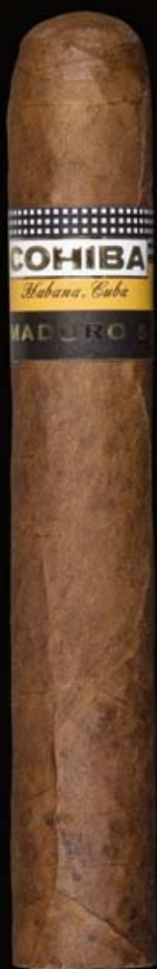
COHIBA GENIOS (10, 25) Cepo 52 {Ø20,64 mm}, L 140 mm