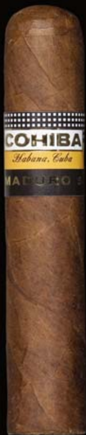
COHIBA MÁGICOS (10, 25) Cepo 52 {Ø20,64 mm}, L 115 mm